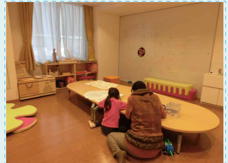
あそびのスペース

わになっておはなしをすることが出来る ぼしよ です。「はじまりのわ」「おはなしのじかん」「おわりのわ」は、ここにあつまります。