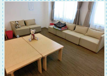
ほごしゃ 保護者のへや