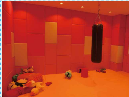
かざん へや 火山の部屋

ぼしよ 場所は、 せんだい 仙台レインボーハウスというところです。 ひろ 広い会場のなかに、 かいじょう たくさんのおへやおもちゃがあります。